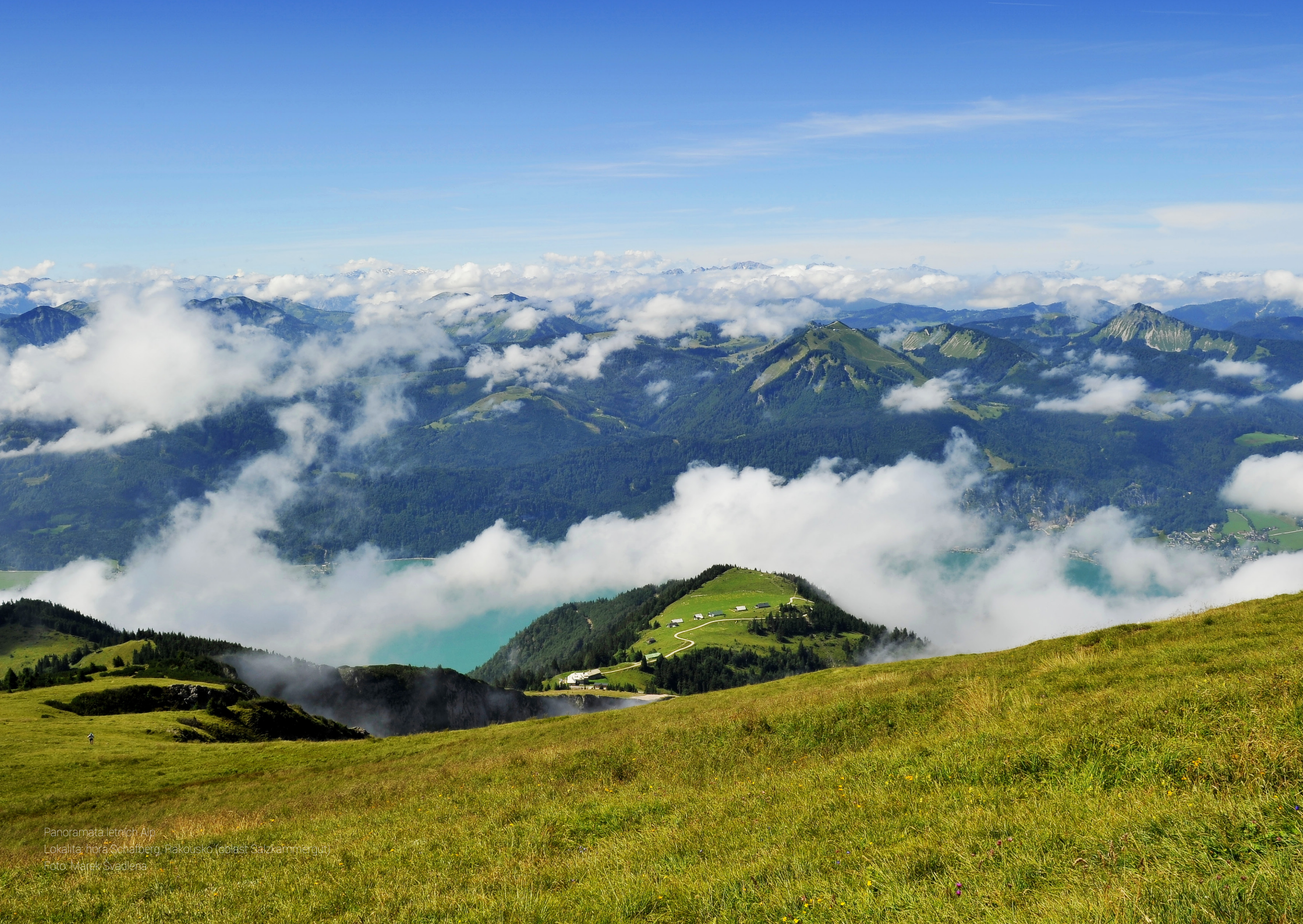
Panoramata leitch Alp Lokalita: hora Schafberg, Rakousko (oblast Salzkammergut)